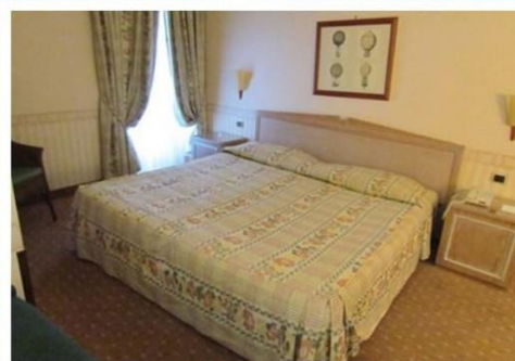
Quote scontate per persona sistemazione camera standard nel trattamento prescelto